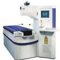
Der Zyoptix 100 der Augenklinik Dardenne

Die Lasik mit Irserkennung stellt eine weiterentwickelte Form der Laserbehandlung dar. Dank ausgereifter Technologie werden die Korrekturen am Auge auf die individuellen Bedürfnisse des Patienten abgestimmt. Im übertragenen Sinne entspricht das dem Unterschied eines Anzugs von der Stange zu einem Maßanzug, der passgenau auf die Körperformen abgestimmt ist. Das ist wichtig, denn Augen sind so unverwechselbar wie ein Fingerabdruck.