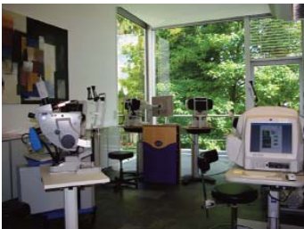
Spezialdiagnostik in der Augenklinik Dardenne

Wie in allen Bereichen der Medizin, wird auch in der Augenheilkunde stetig geforscht und entwickelt, um immer bessere Untersuchungsmöglichkeiten zu erlangen. Hierbei stehen besonders die bildgebenden Methoden im Vordergrund. Ein Gerät zur bildlichen Darstellung und Vermessung des Sehnervenkopfes ist beispielsweise der "Heidelberger Retina Tomograph" (HRT). Das HRT kommt bei der Glaukomvorsorge, die Kontrolle auf Grünen Star, zum Einsatz und stellt gegenüber herkömmlichen Methoden einen großen Fortschritt und eine wesentliche Verbesserung in der Messung dar. Durch die neuen Untersuchungsergebnisse kann der Augenarzt viel früher die entsprechende Therapie einleiten.